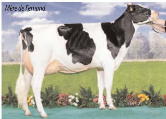
Mère de Fernand

MPG IPV 3167 • TPI 2405 • Mérite net 851