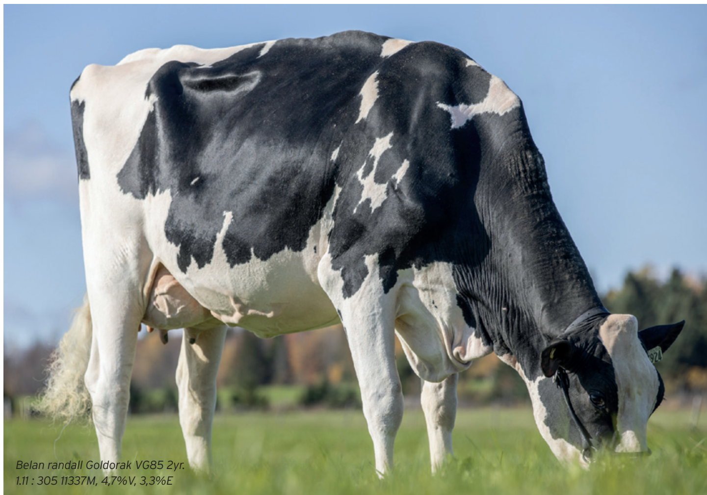
Belan randall Goldorak VG85 2yr. 1.11 : 305 11337M, 4,7%V, 3,3%E

"We hebben nu drie Randalls in productie en er volgen er binnenkort nog meer. Het zijn uiterst complete vaarzen met veel openheid en inhoud om makkelijk te kunnen produceren. Deze drie zijn heel vers al ingeschreven met respectievelijk 84,85 en 86 punten AV! Veelbelovend dus en we kijken al uit naar de rest."