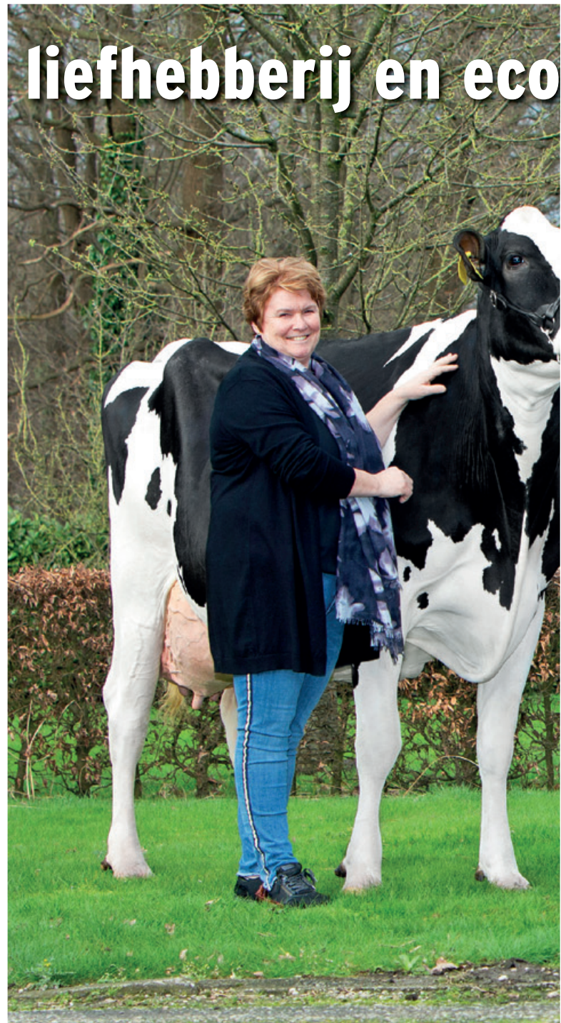
Familie Bloemen met: Links: Euro's Jet 828 (V: Windbrook). Huidige 305 dagen productie: 13987 kgM. Rechts: Mallorca 2 (V: Seaver). Huidige 305 dagen productie: 13987 kgM.

Keuringen zijn één kant van het verhaal, maar als we vragen naar hun fokdoel, komt direct productie naar voren. "Wij fokken op melktypische koeien met veel kracht die makkelijk hoge producties aankunnen. Ook op de gehalten proberen we zo weinig mogelijk toe te geven," aldus Wouter. De koeien worden 2x daags gemolken. Trots laat Wouter de laatste cijfers zien. De koeien produceren gemiddeld op 305 dagen 11763 kgM met 4,38%V en 3,48%E. "Daar zijn we best tevreden mee, maar we denken dat de productie misschien nog wel hoger kan! Bij het paren van de koeien proberen we zoveel mogelijk type en kracht met elkaar af te wisselen om op deze manier balansrijke koeien te krijgen." Momenteel worden de stieren Porter, Victor, Sidekick, Lautrust, Doorman en Fitz hier veelvuldig voor ingezet. De beste koeien die vandaag in de stal lopen zijn dochters van Seaver, Doorman, Control en favoriet Brawler. Jan en Wouter zijn het hier roerend over eens: Brawler is DE stier die fantastisch werk heeft verricht. Van de 20 Brawler vaarzen die op het bedrijf geboren zijn, zijn er nog 15 aanwezig (3 werden als kalfje verkocht). "Brawlers zijn