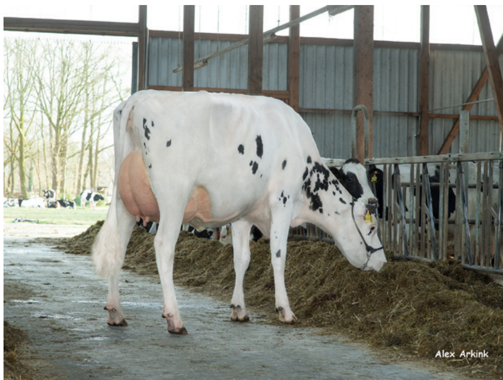
VOS Sheila Gymnast (Duitsland)