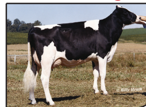
WINDSOR-MANOR ZEBBEE EX-91-2E-USA 04-06 305 13785M 538F 3.9% 426P 3.1%