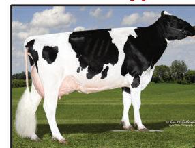
OCD PLANET DANICA EX-93-5YR-USA 03-01 305 15527M 540F 3.5% 482P 3.1%