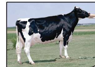
LARCREST JUROR CHANEL EX-93-3E-USA 09-00 305 19328M 784F 4.1% 640P 3.3%