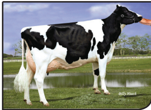
LADYS-MANOR RUBY D SHAWN EX-90-5YR-USA GMO DOM 04-04 305 15168M 708F 4.7% 497P 3.3%