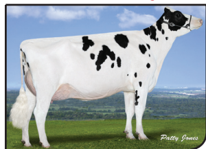
EDG DAHLIA MOGUL 2257 VG-86-5YR-CAN 04-01 302 16995M 470F 2.8% 494P 2.9%