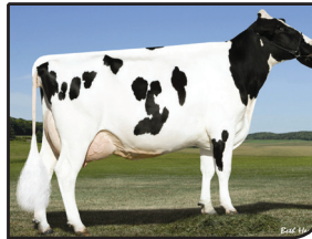
PINE-TREE MONICA PLANETA VG-86-3YR-USA 02-01 305 11503M 420F 3.7% 413P 3.6%