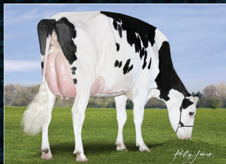
Dam: Brabantdale Rambo Angeface VG-85