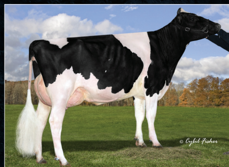
Dam: Siemers Mogul Apple-Star EX-91