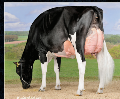
Dam: Galys-Vray EX-94