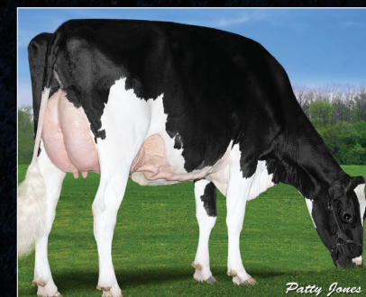
2 nd Dam: Claynook Divinity Unix VG-88-3YR