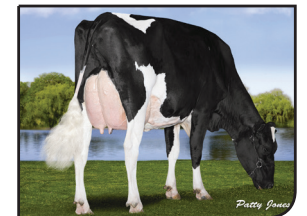
RANSOM-RAIL FACEBK PARIS VG-86-2YR-CAN 02-03 193 7746M 316F 4.1% 244P 3.2%