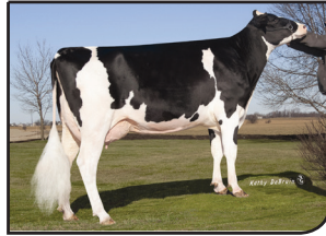
PLAYBALL MNOM BOUNTY VG-87-6YR-USA 02-03 305 13377M 546F 4.1% 421P 3.1%