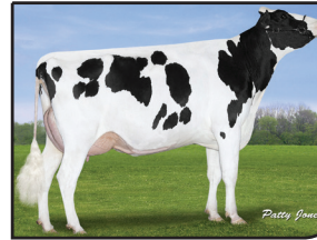
MS FARNEAR MICA MARGARITA VG-87-2YR-CAN 02-00 305 11425M 443F 3.9% 363P 3.2%