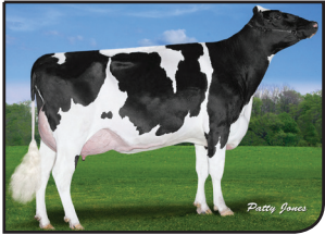
CLAYNOOK FONDNESS SUPERSHOT VG-85-2YR-CAN 02-01 305 13282M 383F 2.9% 417P 3.1%