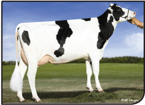
SANDY-VALLEY ROBUST RUBY EX-90-6YR-USA 02-04 305 13358M 431F 3.2% 440 3.3%