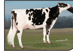
CO-OP BLUMEN DAY 4292 VG-87-2YR-USA 01-11 305 9417M 436F 4.6% 334P 3.5%