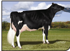
COOKIECUTTER MOM HALO VG-88-2YR-USA 02-00 305 14093M 729F 5.2% 510P 3.6%