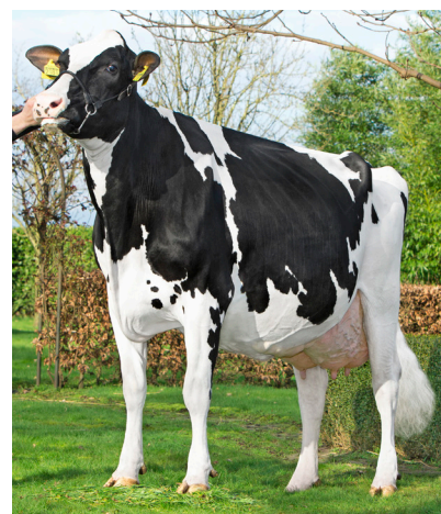
Euro's Jet 828 EX-90 engendrado por Gillette Windbrook 4,11 305 días 16,000 kg de leche 4,5% grasa 3,4% proteína