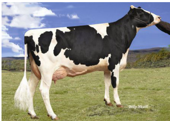
TORREY FARMS DAIRY SAILING 904