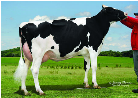
BLUE-GENE SAILING SHIPPEY