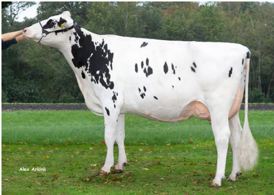
DIEKERS K&L DL WHISKEY DAM