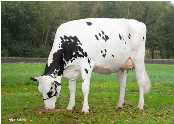
DIEKERS K&L DL WHISKEY DAM