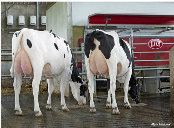
STANTONS APPLICABLE DAUGHTERS

L to R - ZANDEBURG APLI EBONY - ZANDEBURG APLI CAMILA