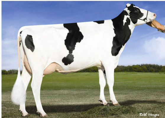
SANDY-VALLEY ROBUST RUBY FIFTH DAM