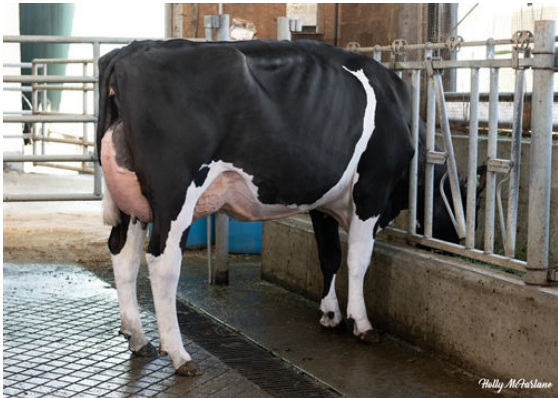
WESTCOAST FSTBL FAR8167 10707 DAM