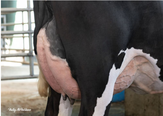
WESTCOAST FSTBL FAR8167 10707 DAM