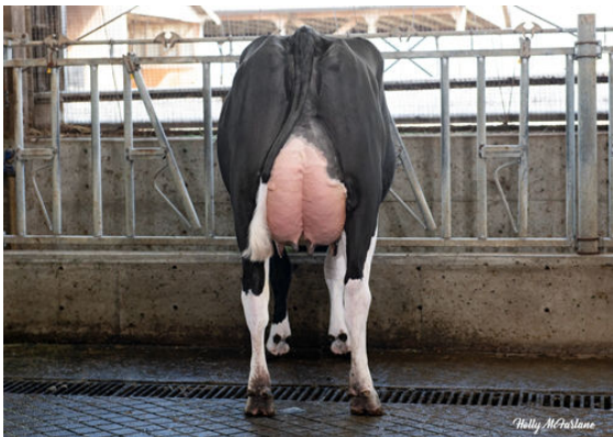
WESTCOAST FSTBL FAR8167 10707 DAM