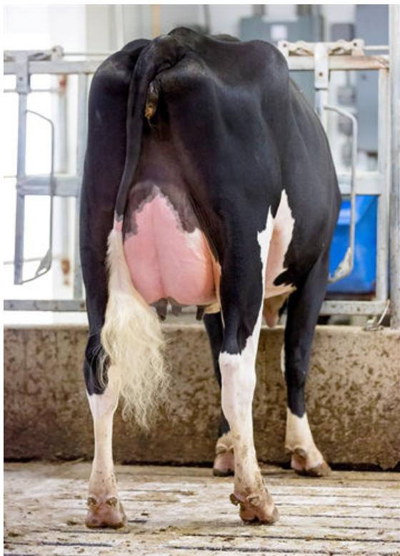
SIEMERS GD PARIS 36374