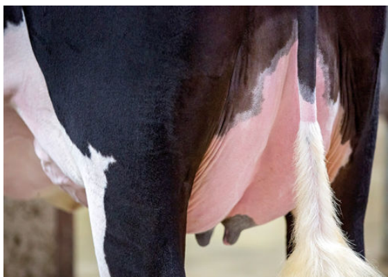
SIEMERS GD PARIS 36374