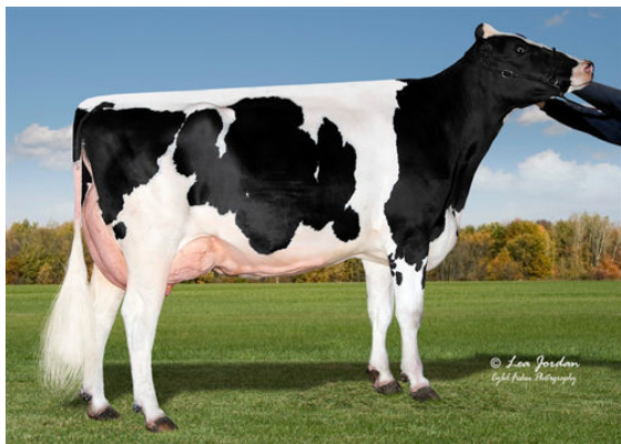
COOKIECUTTER HOPELYNN FOURTH DAM