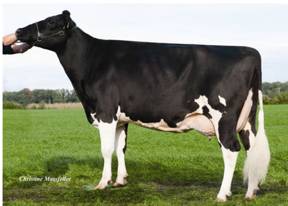
KAIRO FIFTH DAM