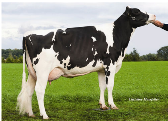
KANU FOURTH DAM