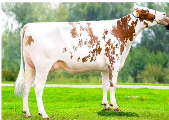
3STAR PATTY DAM