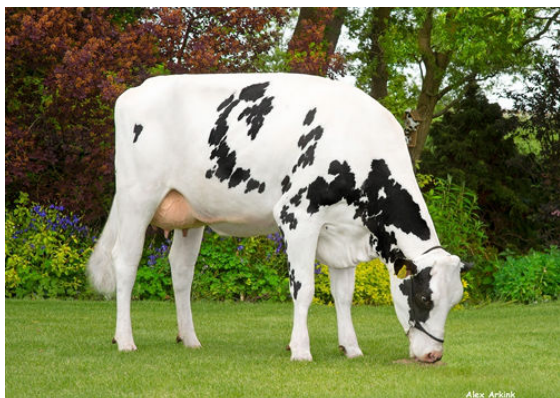
3STAR RT PATSY GRANDDAM