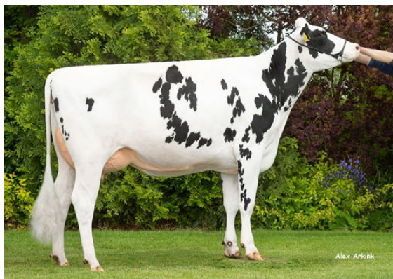
3STAR RT PATSY GRANDDAM