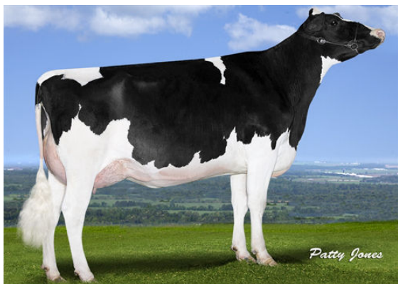
GIL-GAR PREDES MERLOT DAM