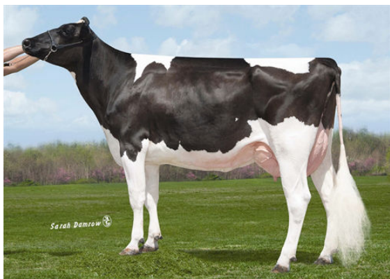
SULLY PLANET MANITOBA THIRD DAM