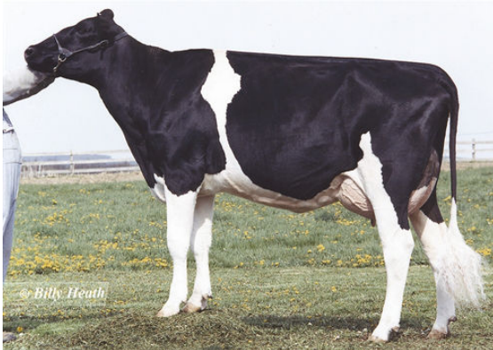
MRS SCHULTZ BWM BLAIN FIFTH DAM