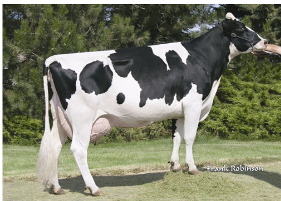
SEAGULL-BAY OMAN MIRROR FOURTH DAM