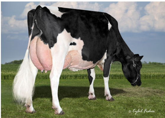
COOKIECUTTER MOG HANKER GRANDDAM