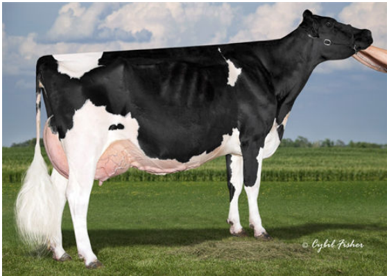
COOKIECUTTER MOG HANKER GRANDDAM