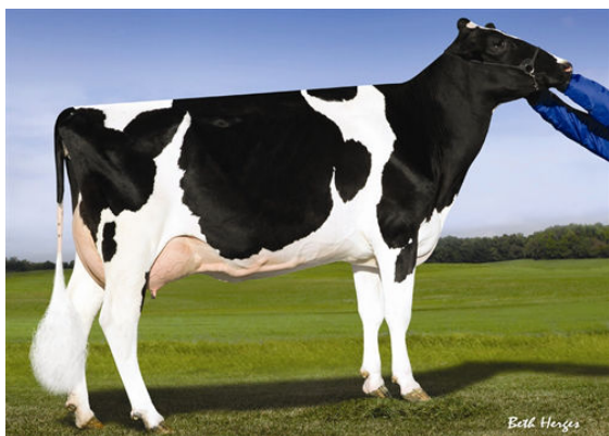
PINE-TREE 2149ROBST 4846 THIRD DAM