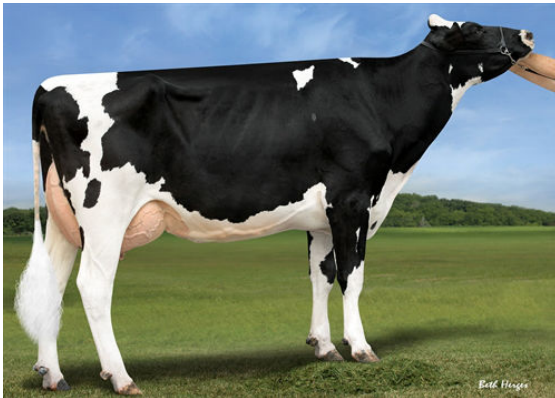
FAIRMONT DELTA RHONDA DAM