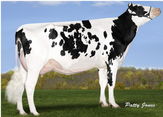
SILVERRIDGE V MUNITION EARWIG FOURTH DAM