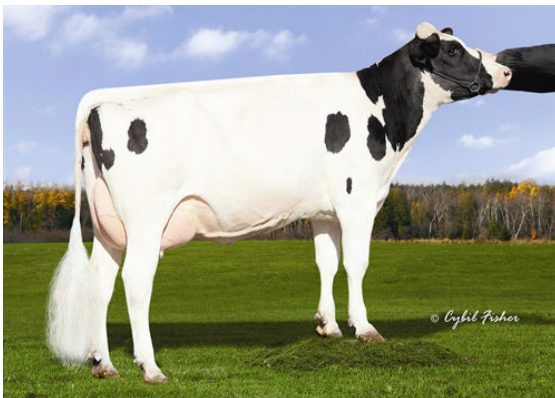
KINGS-RANSOM IT DISTINCT FOURTH DAM