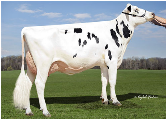
KINGS-RANSOM DELICIOUS GRANDDAM