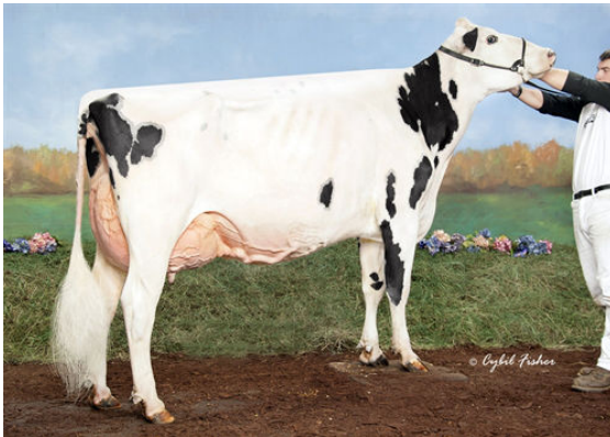
KINGS-RANSOM KB DELICATE THIRD DAM