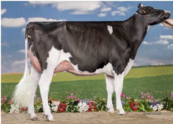
SABBIONA 1607 DAUGHTER