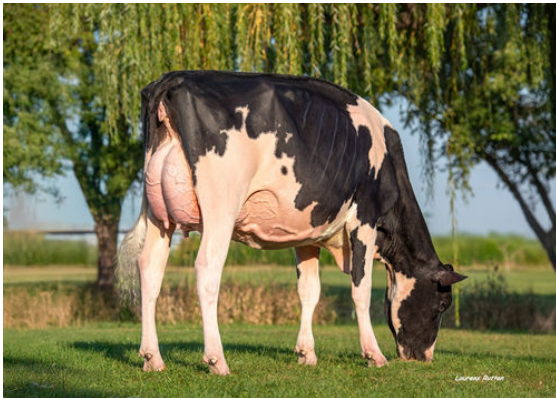
GENOSOURCE JAWDROPPER DAUGHTER