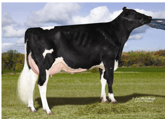
COOKIECUTTER MOM HALO

DAM - NOMINATED ALL-AMERICAN MILKING YEARLING 2019