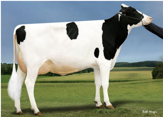
SANDY-VALLEY MD PLEASURE FOURTH DAM