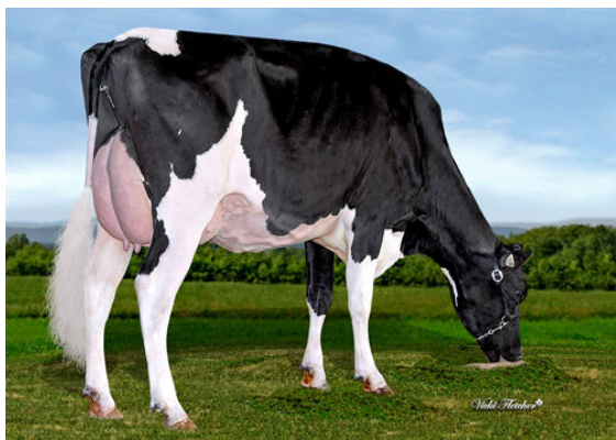
FEPRO PERFECT LINDOR DAM