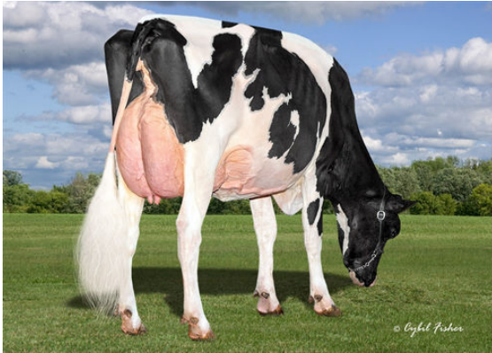
SIEMERS DOC HANAN 28286 DAM