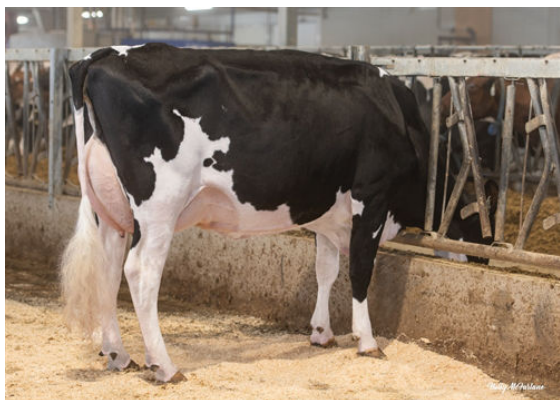
PEAK ZEMINI HOPELYNN DAM