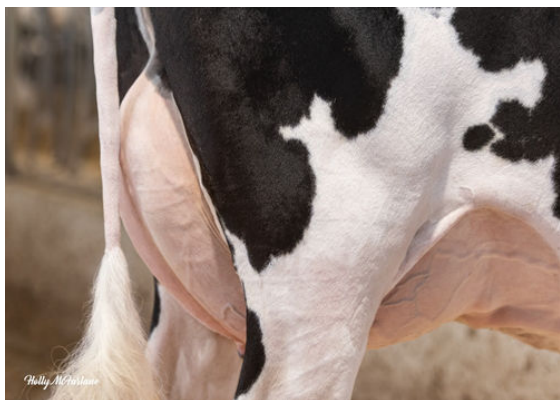
PEAK ZEMINI HOPELYNN DAM