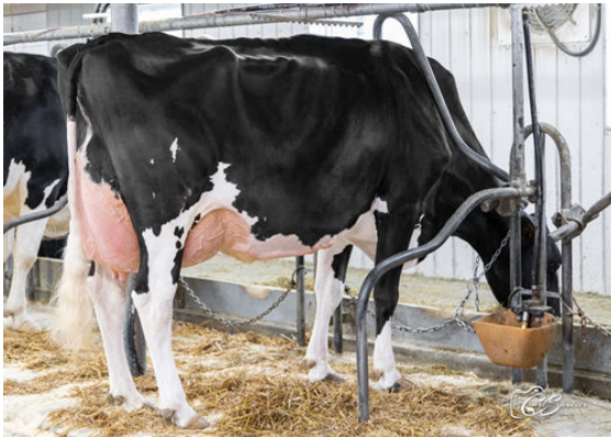
SARTIGAN DEALMAKER RALEUSE DAUGHTER