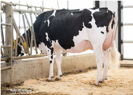
EARLEN DEALMAKER MISTY DAUGHTER