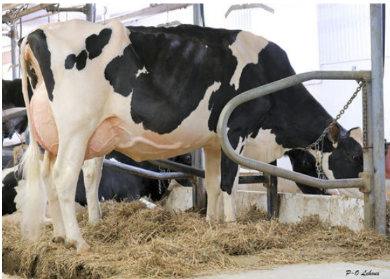
LEHOUX DEALMAKER RALIE