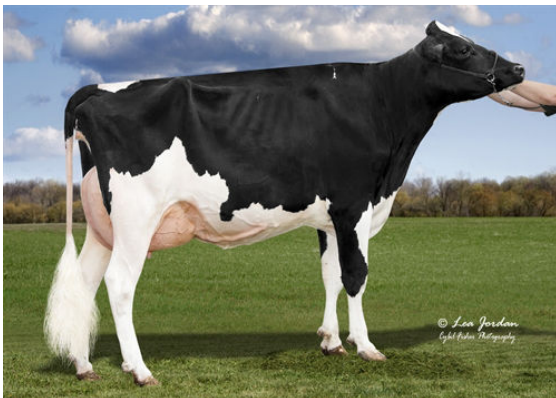
JIMTOWN KD NARCISA DAM