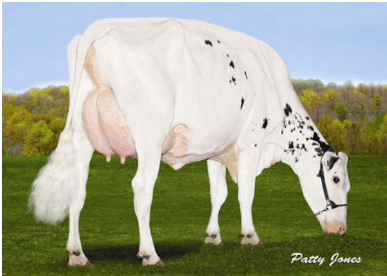
VELTHUIS SG SNOW EVENT FOURTH DAM