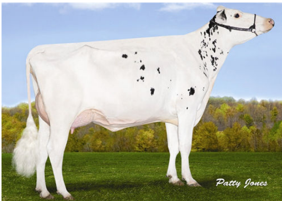
VELTHUIS SG SNOW EVENT FOURTH DAM