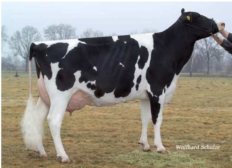
HPH Malmö EX91 Großmutter von GHH Frieda