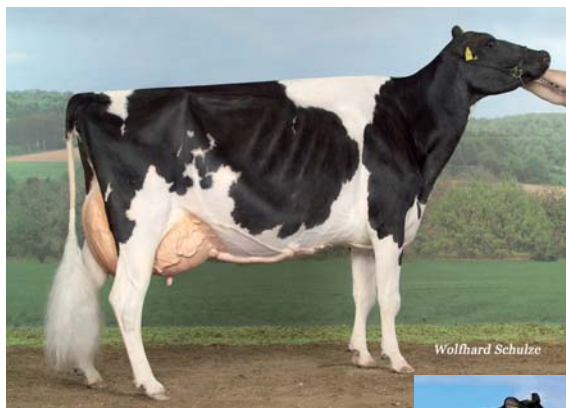
Schöne EX93, Miss Sachsen Großmutter von Saphir