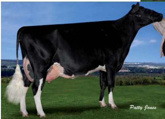
Comestar Isaki Duplex EX Tochter von Isabelle VG87