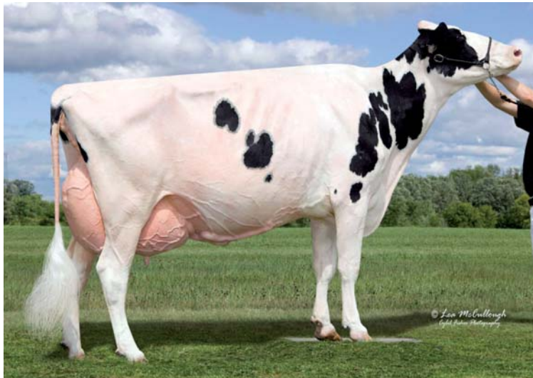
Blondin Lyster Beauty EX92, Vollschwester zur Mutter