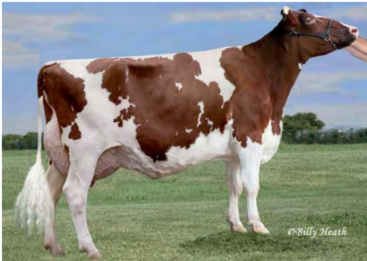
Mae-Red EX92 Mutter von Miami-Red