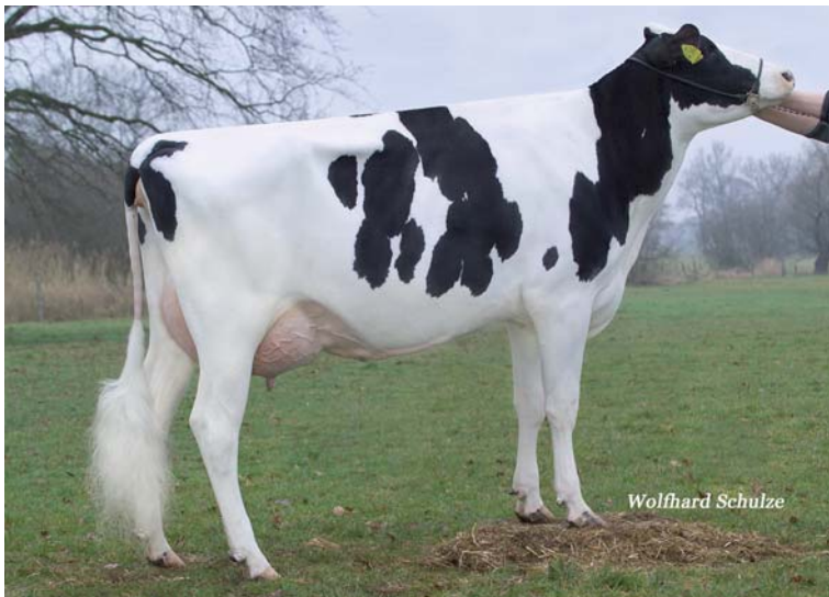
Hanuta VG89, Tochter von Hübsche