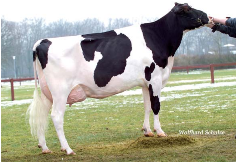
Britania EX 92 (2. LA) – Siegerin der mittelalten Kühe Schau der Besten 2005