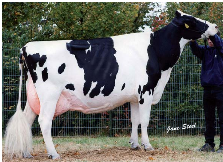
WFD Miel EX90 Großmutter von GHH Marisa