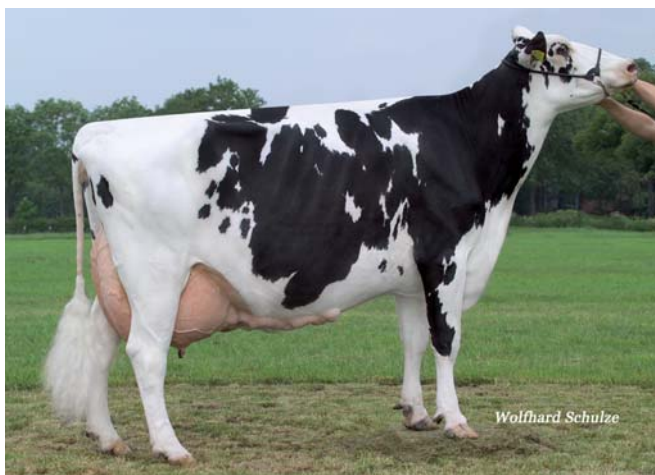
GHH Lischen EX90 Großmutter von GHH Lina