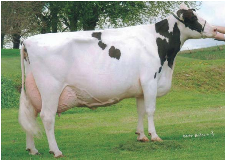
Moondale Leader Pat EX94