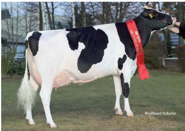
Britania EX 92 (3. LA) – Miss Schau der Besten 2006 ist die Großmutter von Babs und Babette