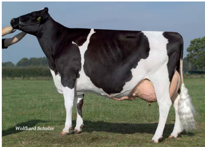
GHH Tracy EX90 Großmutter von GHH Tilian und Urgroßmutter von GHH Theda