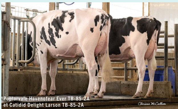
Poplarvale Havenofear Ever TB-85-2A et Catidid Delight Larson TB-85-2A