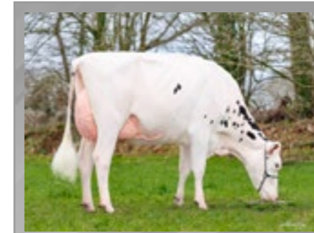
JB Toullec Ubladdi rc, mère de Assyro