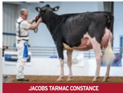
JACOBS TARMAC CONSTANCE

Westcoast TARMAC BAROLO X Dicklands King Doc 3503 TB-87 x Dicklands Chief 3041 TB-85