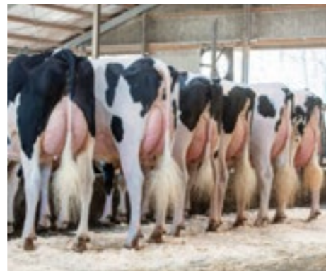
Filles de ALLGAUD Chez Morisse Holsteins, Bremen (Allemagne)