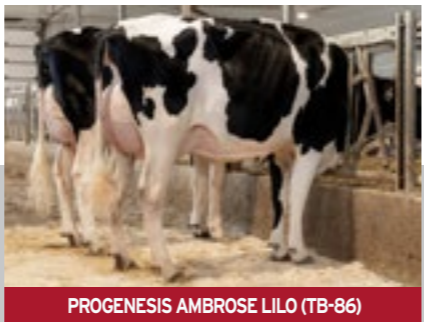
PROGENIS AMBROSE LILO (TB-86)