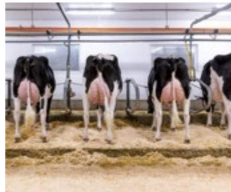
Filles de HAVENOFEAR (chez Ferme DUBENOIT, Canada)