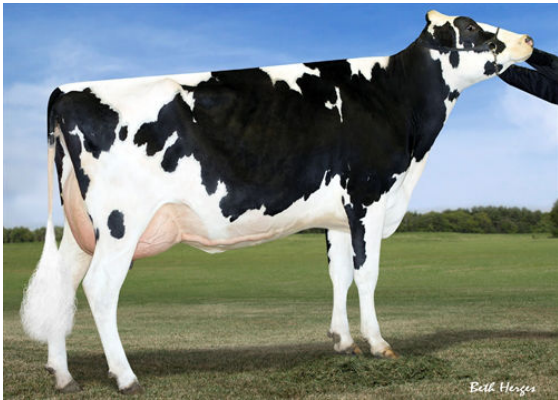
B-ENTERPRISE SUPER GIGI THIRD DAM