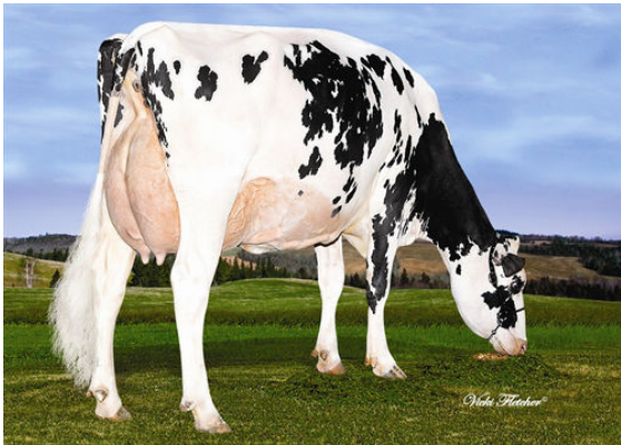
DELORME BRAWLER JOALYA