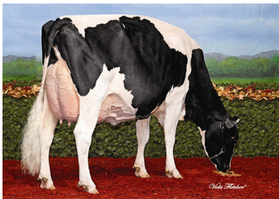
WALNUTLAWN STEADY JULIA