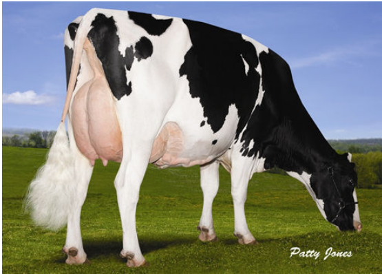
DOUGLEA WINDBROOK LOYOLA