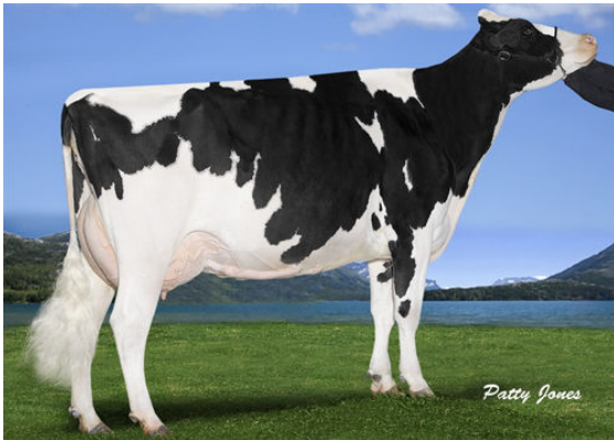
HARTVELD WINDBROOK JEWEL