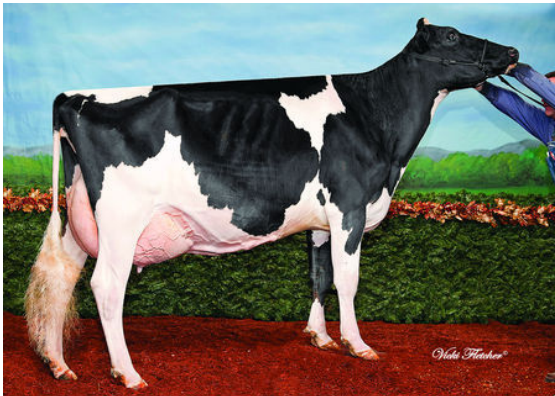
DUALANE WINDBROOK CIERRA