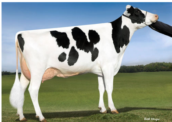
OCD SUPERSIRE 9882 GRANDDAM