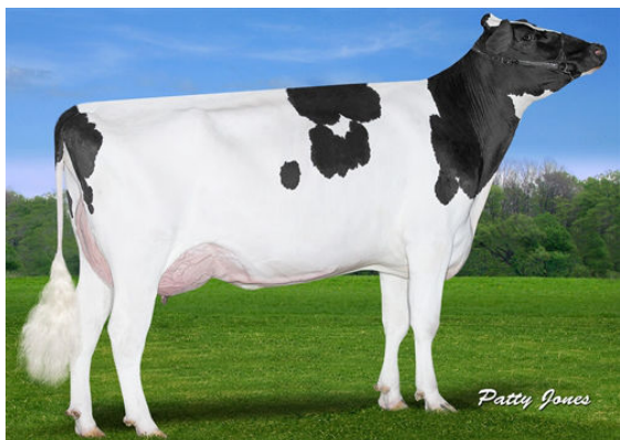
CLAYNOOK FABBY SILVER FOURTH DAM