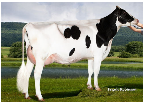
CHERRYPCOL LEE THIRD DAM