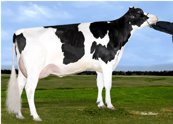
BLONDIN TJR BOMBERO MAPLE FOURTH DAM