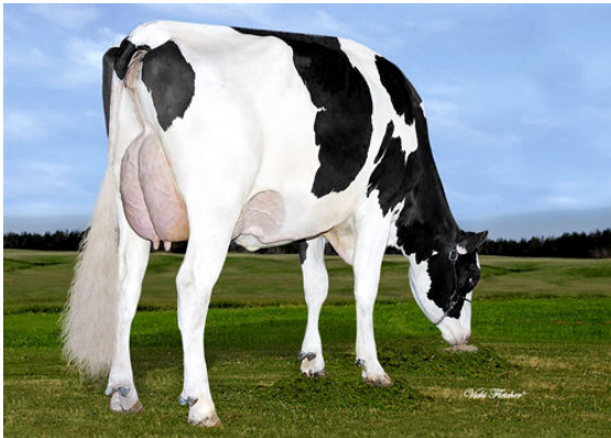
BLONDIN TJR BOMBERO MAPLE FOURTH DAM