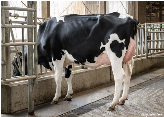
PROGENESIS ACTIONMAN AMIDALA DAM