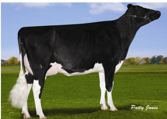
FREUREHAVEN FGS LUCY THIRD DAM