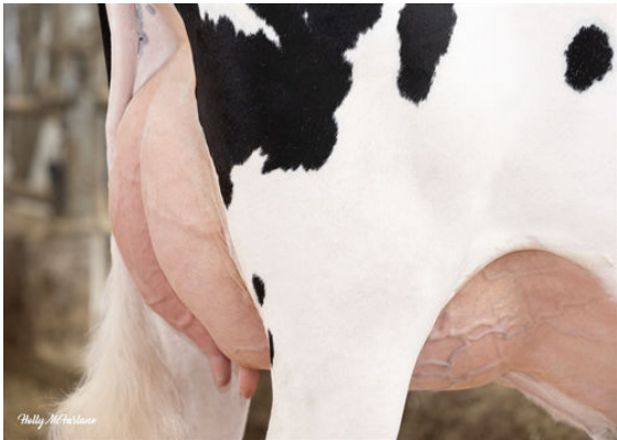
WALNUTLAWN DESTINATION LOVE DAM