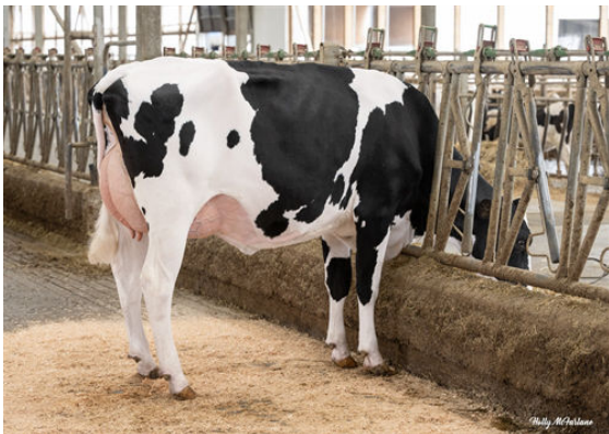
WALNUTLAWN DESTINATION LOVE DAM