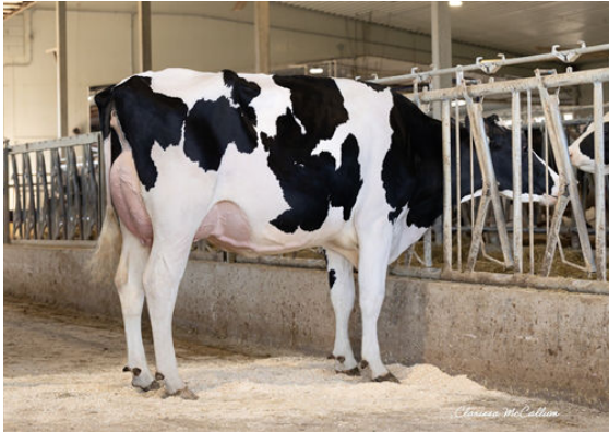
PROGENESIS TARMAC ALEXIS DAM