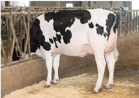
PROGENESIS RANGER ANISA GRANDDAM