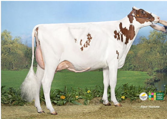
JB TOULLEC ASTRA RED DAM