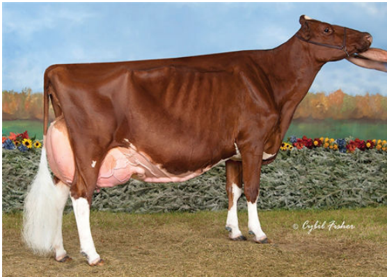
KHW REGIMENT APPLE-RED FOURTH DAM