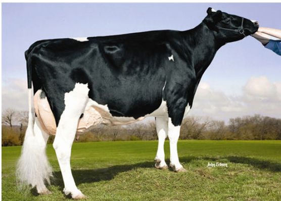
KAMPS-HOLLOW ALTITUDE RC CV TL FIFTH DAM