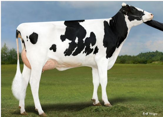
PINE-TREE 7831 LION 598 DAM