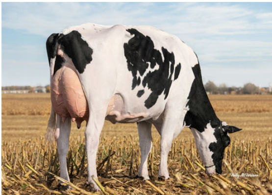
LIBERTY-GEN HIGH ACHIEVER